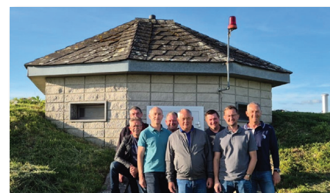
Vorstandsmitglieder vor dem Hochbehälter.

Auch wenn bis jetzt noch kein offizieller „Wassersparerlass“ ausgesendet wurde, ersucht die Wassergenossenschaft um Sparsamkeit mit unserem Trinkwasser. Die Ergiebigkeit der Wasserspender geht wegen der Trockenheit drastisch zurück.