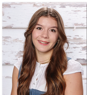
Hauzenberger Pia Schi-Akademie Schladming Ausgezeichneter Erfolg