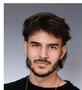
Scharinger Niklas Realgymnasium Rohrbach