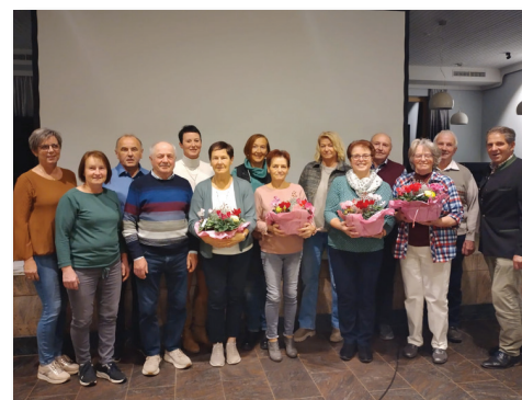
Die Preisträger:innen der Blumenschmuckkehrung.

engagierten Gemeindegänger:innen für die Mühe und Pflege bei der Gestaltung der Gärten und beim Schmücken der Häuser in unserer wunderschönen Marktgemeinde.