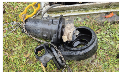
Ein durch Hygieneartikel verschmutztes Pumpwerk.

Apropos: Mit einer Kanalkamera können die Verursacher auch ausgeforscht und die zusätzlichen Reinigungskosten verrechnet werden. Daher die große Forderung/Bitte - KEINE Feuchttücher und Damenhygieneartikel im WC entsorgen, sondern ab damit in die Restmülltonne.