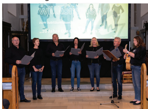
Die Chorreichen 7 bei einem ihrer Konzerte.