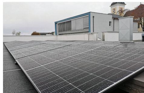
Mit der PV-Anlage am Dach des Hauses der Kultur wird bereits ein wichtiger Beitrag zur Klimaneutralität geleistet.

Zur Bedarfsdeckung 2040 sind in St. Peter 4.086 MWh/a erneuerbarer Energie zu erzeugen. Dafür müssen PV-Flächen von insgesamt 4,1 ha zur Verfügung gestellt werden (1,4 % Bezirksanteil).